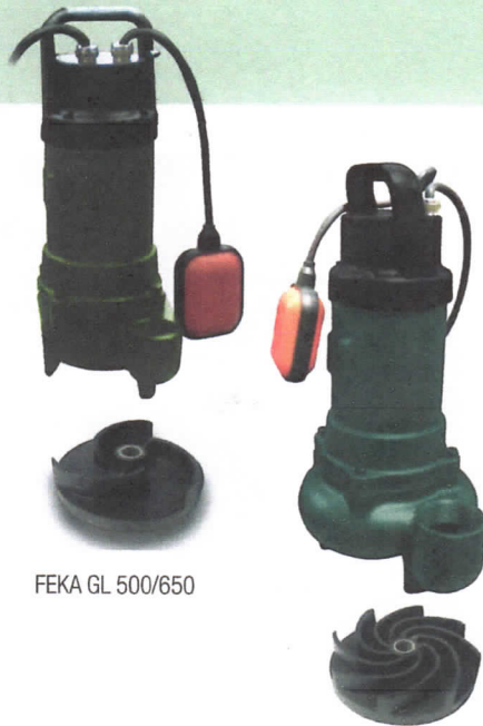
FEKA GL 500/650